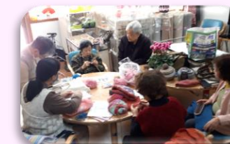
編み物教室の様子

特定非営利活動法人アイギスは、梨香台団地を拠点にサロン運営や高齢者・障がいのある方の買い物援助、地域の居場所づくりを行ったり、元気体操教室を開催したりしています。団地内の花壇整備などを通して近隣の方々が暮らしやすい地域づくりをすすめています。