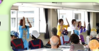
ふれあい会食会での活動

音楽から感じられる様々な女性像や、その感情を表現し、観て下さる方々の心に響くよう日々練習を重ねています。