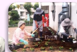
団地内の花壇整備